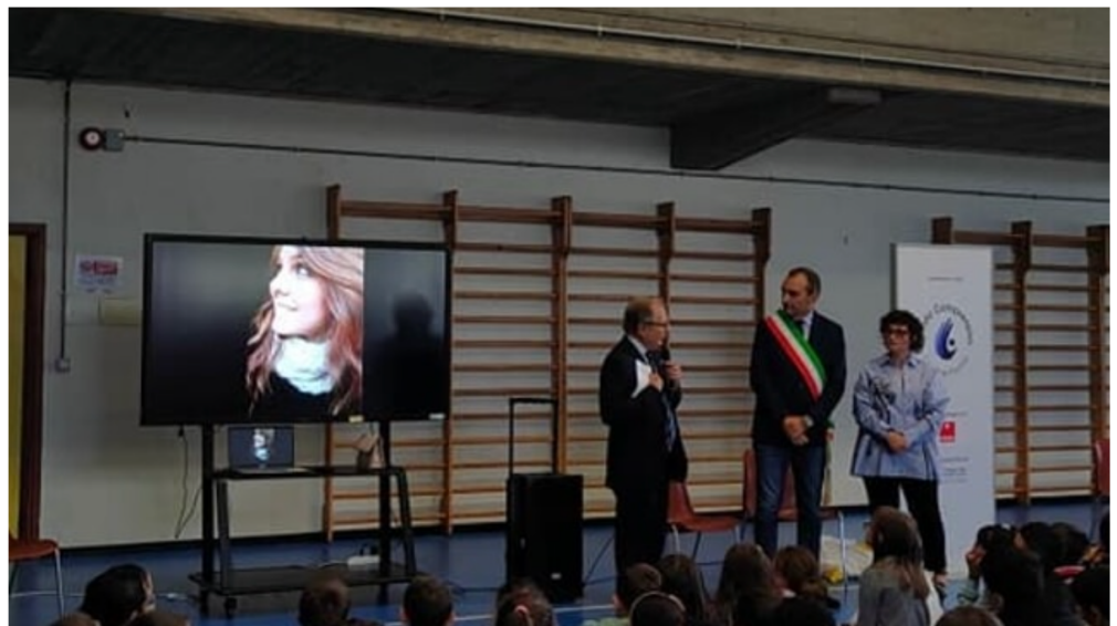
La cerimonia

La cerimonia si è svolta venerdì 20 settembre all'ormai ex comprensivo Sidoli